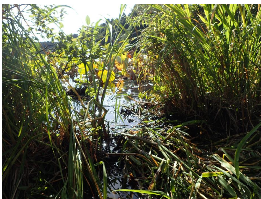
Fig. 3. Collection site on Akita Prefecture.

2 種の生息環境 オニギリおよびサメハダの両種が採集された環境はため池 (Fig. 3) であり、海域から直線距離で 2 km 圏内の沿岸部に位置し、採集地点における池の水深は約 90 cm であった。池底は枯死木や枯葉などの腐植質が堆積